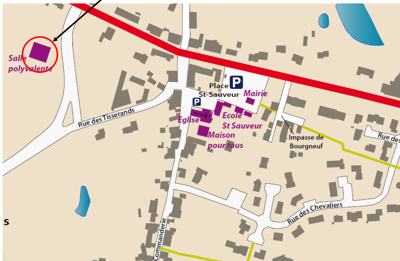
Plan de situation de la salle :

Adresse : Route de la Mine - 79700 LE TEMPLE